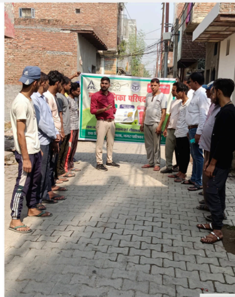
“ नगर पालिका परिषद लोनी में आईटीसी मिशन सुनहरा कल के अंतर्गत वार्ड नंबर 31 में कचरा पृथक्करण के विषय में समझाया गया तथा गीले कचरे को खत्म करने के लिए होम कंपोस्टिंग के लिए प्रेरित किया गया ”